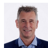
P. Nap EPA-W deskundige